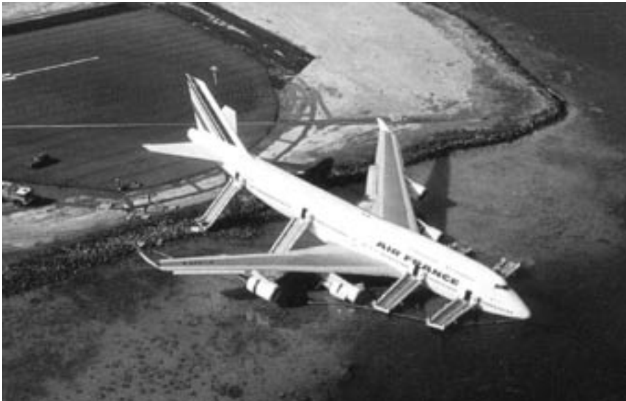
L'accident du Boeing 747 d'Air France en 1993 a nécessité la mise en œuvre du plan de secours spécialisé de l'aéroport de Tahiti-Faa'a.

transport aérien joue de plus en plus un rôle essentiel dans la vie de nos concitoyens, tant du point de vue économique que du point de vue humain. L'avion réduit l'isolement, sauve des vies humaines, apporte des biens, des outils, transporte les touristes, exporte les produits. La Polynésie française possède, avec plus de cinquante aérodromes, un réseau très maillé et en même temps étendu sur une aire grande comme l'Europe. Face à cette dimension, chacun peut mesurer la complexité du problème de gestion de crises. Les services de l'Etat en Polynésie française doivent donc mettre en œuvre, adaptées en continu, les organisations en fonction des moyens humains, et matériels sans cesse en évolution. La loi organique du 27 février 2004 portant statut d'autonomie de la Polynésie française implique également les services de la Polynésie française (article 38). Ainsi, les autorités locales de la Polynésie française, le gouvernement de la Polynésie, sont désormais impliqués dans la préparation des plans d'urgence.